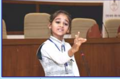
संस्कृत श्लोक वाचन