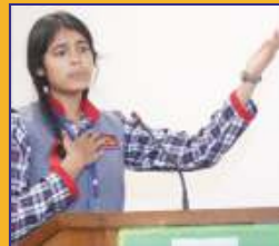
हिन्दी काव्य पाठ