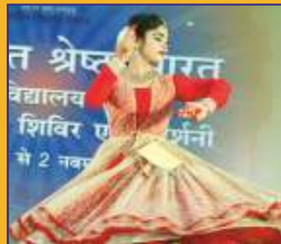
एकल शास्त्रीय नृत्य