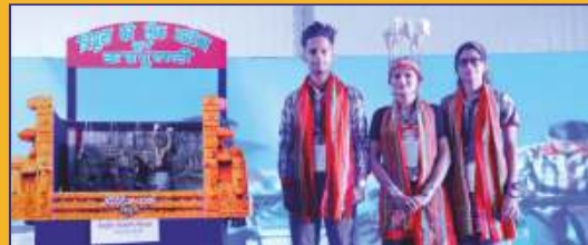
कलाकृतियों की प्रदर्शनी