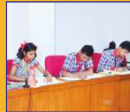
ऑन स्पॉट पेन्टिंग